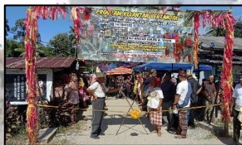
PASAR PENDEKAR, KG. GUNTONG