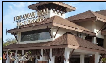
TOK AMAN BALI RESORT, KG. DALAM RHU