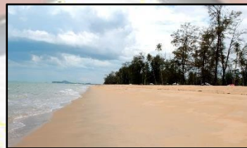
PANTAI BISIKAN BAYU, KG. DALAM RHU