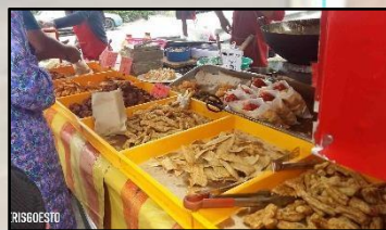
ZON HASIL LAUT (KEROPOK LEKOR), KG. DALAM RHU