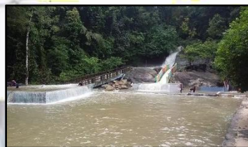
JERAM PASU, KG. PADANG PAK AMAT