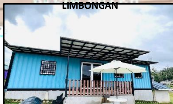
KOTAK HOUSE @ MUBA RESORT, KG. BUKIT MERBAU