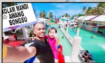
AWANG BONGSU RESORT, KG. DALAM RHU