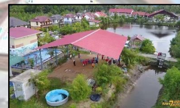
RAJA DAGANG RESORT, KG. DALAM RHU