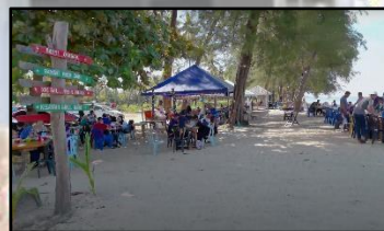
RESTORAN BUNYI OMBAK, KG. AIR TAWAR