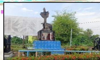
LAMAN WARISAN TOK JANGGUT, LIMBONGAN