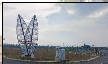
TAMAN AWAM BUKIT GEDOMBAK, LIMBONGAN