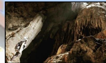
GUA BUKIT JAWA, KG. SELISING