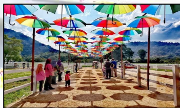
JERAM MENGGAJI AGRO RESORT, KG. SUNGAI DURIAN