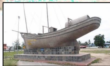
DATARAN BAHTERA, KG. TOK BALI