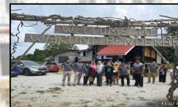
WARUNG PENDEKAR, KG. JERAM